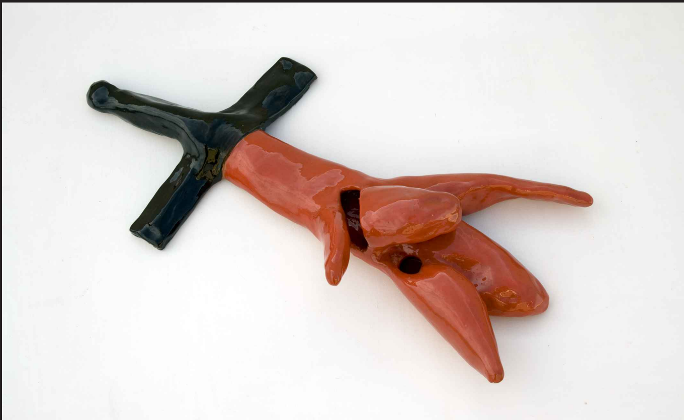
'Coyolxahuqui desmembrada brotando mirra de sus heridas; espada'. Cerámica. 2008