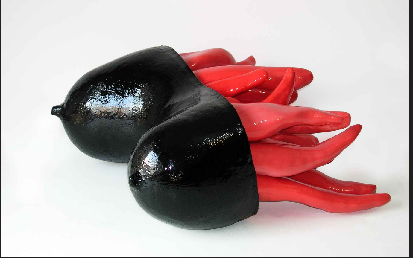
'Coyolxahuqui desmembrada brotando mirra de sus heridas; pechos'. Cerámica . 2008