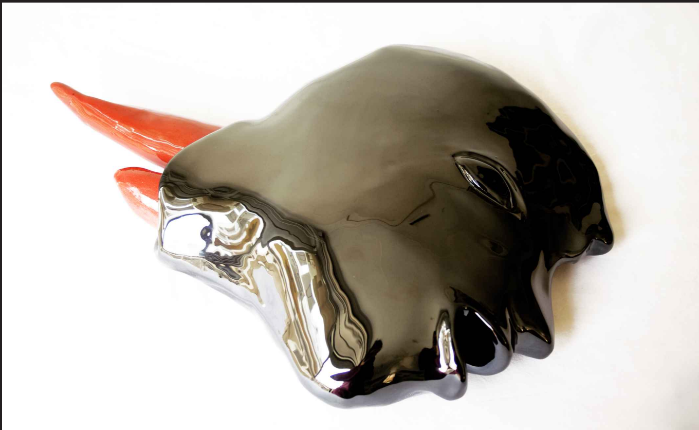
'Coyolxahuqui desmembrada brotando mirra de sus heridas; cabeza'. Cerámica . 2008