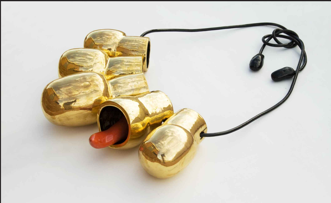
'Collar de cabezas'. Cerámica y cable. 2008