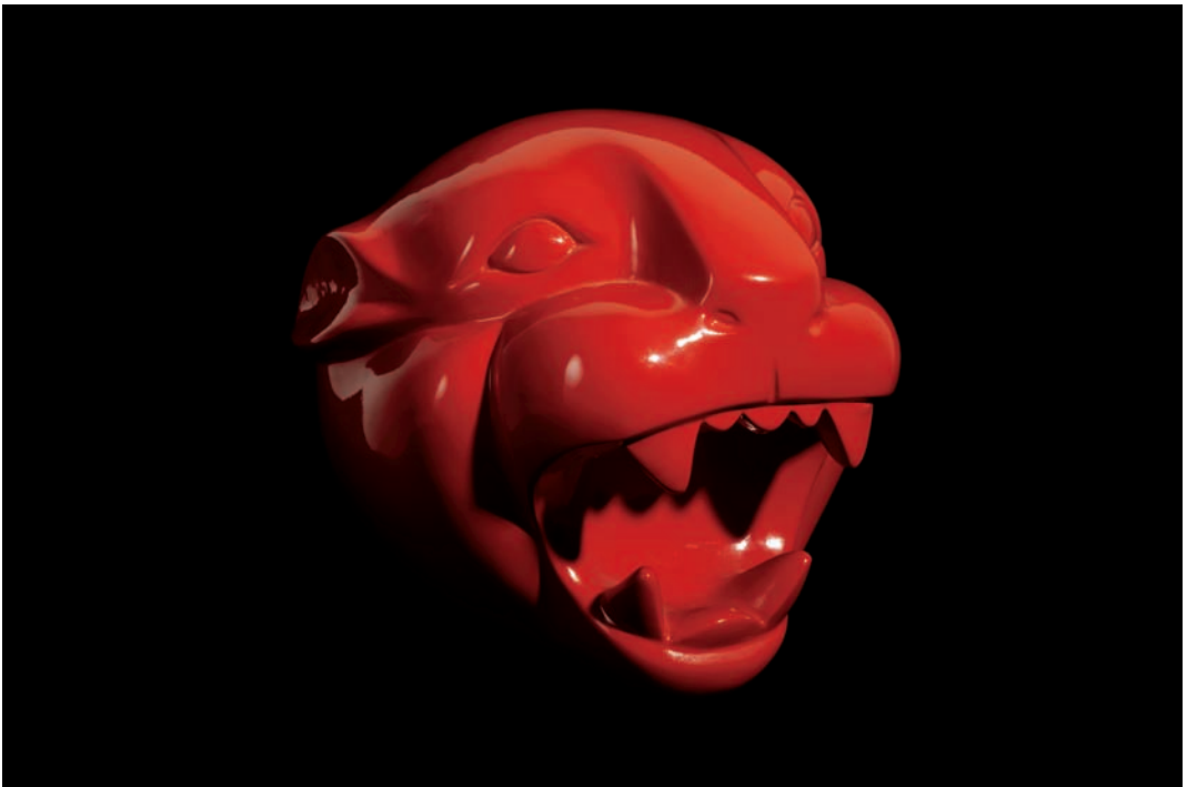
'Ofrenda de cien jaguares para el León Blanco'. Resina lacada. 19 x 22 x 26 cm.