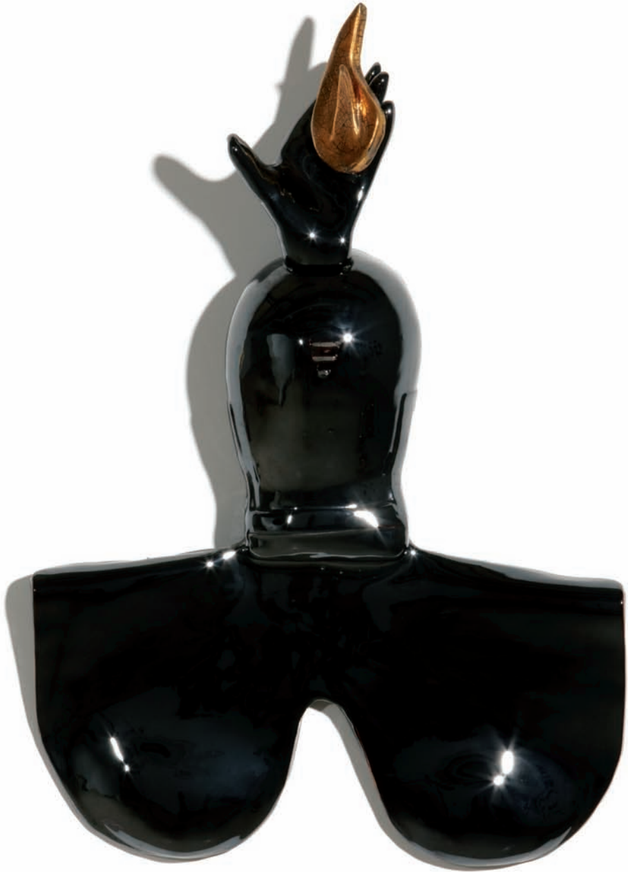
'Pectoral Xipe Totec'. Cerámica esmaltada, 56 x 36 x 15 cm.