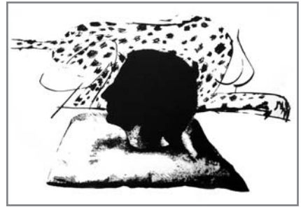
'Cortarte la cabeza y ser custodiado por una esfinge'. Litografía. 36 x 56 cm.

El aglutinante de todo el discurso estético que reflejan sus obras, no es sino la experiencia íntima, impúdica y transgresora de Ella misma en contacto con los secretos arcanos de la naturaleza en estado genuino. El círculo dibujado en el suelo con repetidas cabezas de jaguar mostrando las afiladas fauces, los cuernos puntiagudos de un ciervo coronando la calavera animal, la garra felina con las amenazantes uñas punzantes, los guantes de percebes llenos de aristas, la espada, la cruz y en la cima de la ascensión iniciática, las cabezas cortadas, los mitos, la sangre, la desmembración y la escisión. Se diría que Susana procede a la aniquilación del yo, a la disolución del nosotros, y en su procedimiento ritualista, chamánico y conceptual se sirve ya no de la antigua superstición de "lo encontrado" como presagio fatal o visión anticipada, sino más bien de la intuición estética contemporánea inaugurada por los ready mades de Marcel Duchamp que vienen a ser los procedimientos intelectuales, estéticos o chamánicos por los que se deconstruye y reconstruye