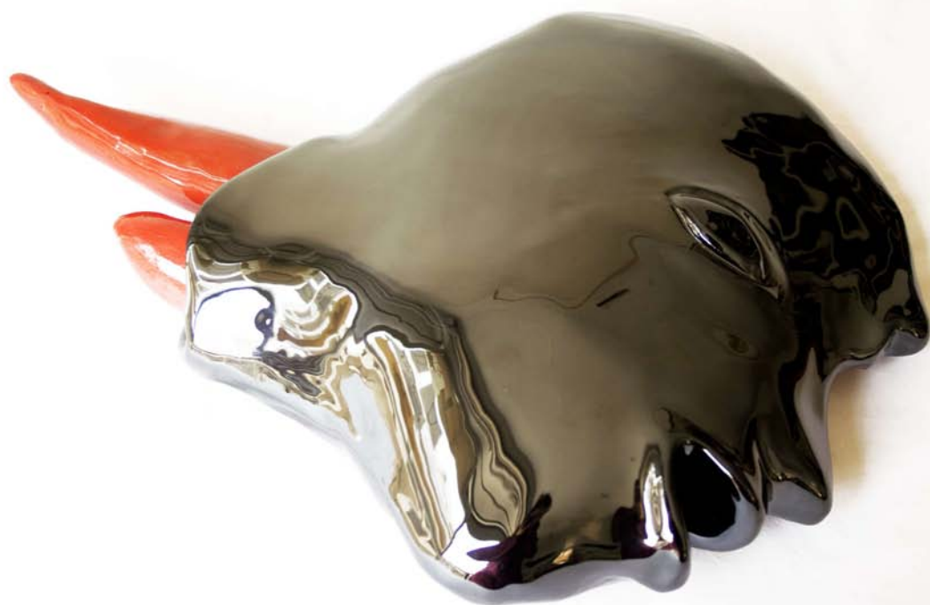
'Coyokahuqui desmembrada sanando sus heridas con mira; cabeza'. Cerámica esmaltada. 23 x 22 x 10 cm.