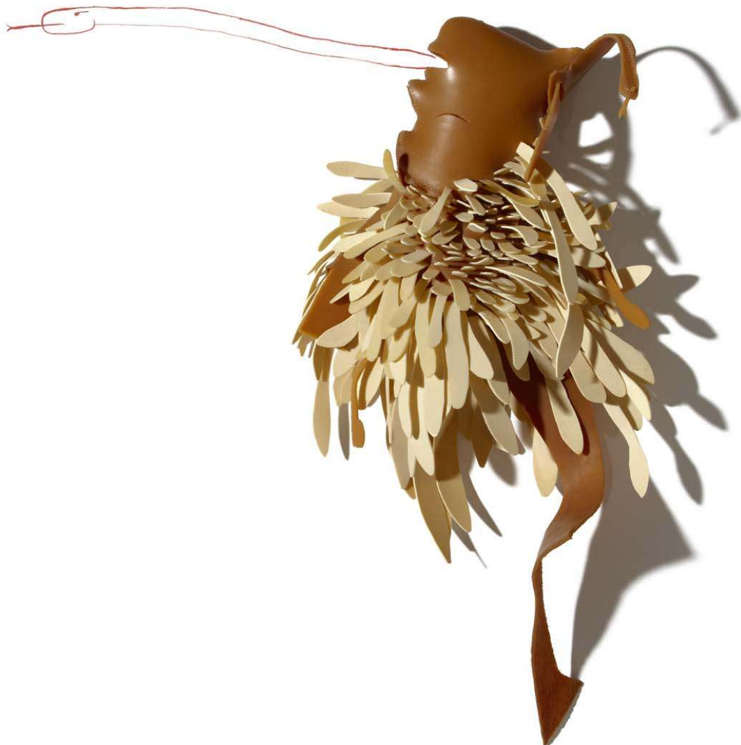
'Coyokahuqui decapitada manando una serpiente roja de su boca'. Goma y acuarela. 8 x 25 x 11 cm.