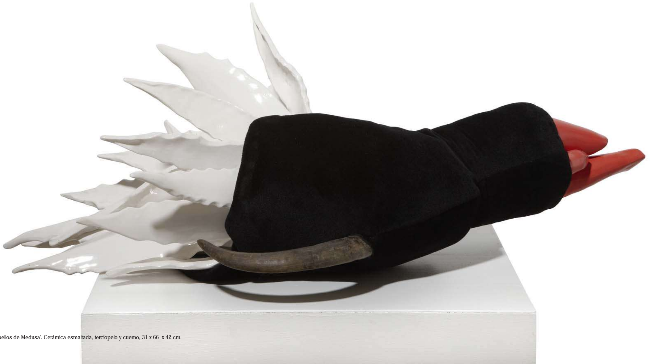
'El Vigor de los cabellos de Medusa'. Cerámica esmaltada, terciopelo y cuerno, 31 x 66 x 42 cm.