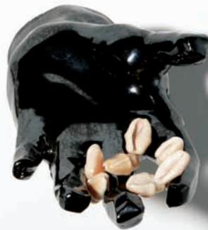
'la ofrenda'. Cerámica esmaltada y cauris. 13 x 19 x 13 cm.