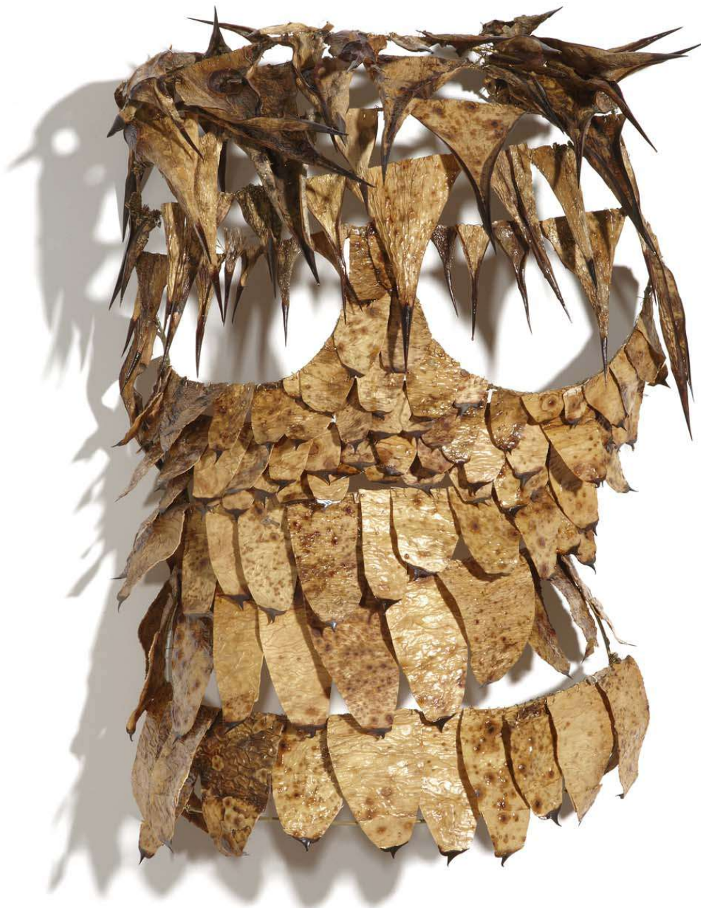
'Amadura para Medusa; coraza'. Latón y penca de agave. 52 x 40 x 21 cm.