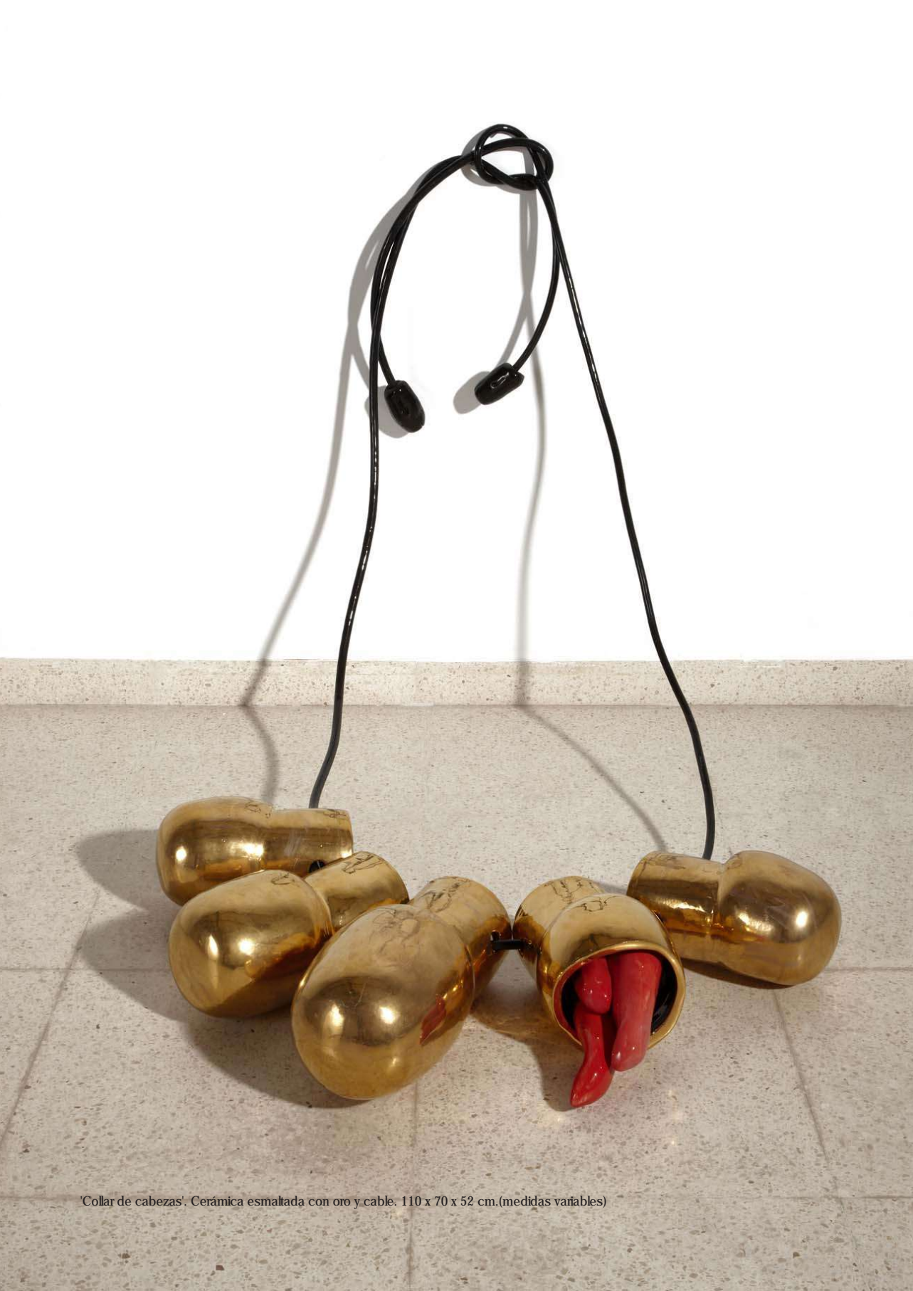
'Collar de cabezas'. Cerámica esmaltada con oro y cable. 110 x 70 x 52 cm.(medidas variables)