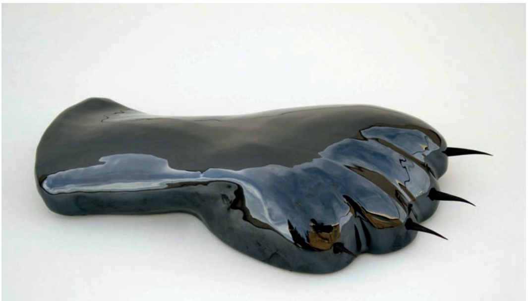
'El Aliento'. Cerámica esmaltada y espinas de agave. 5 x 21 x 12 cm.

This plastic and conceptual reformulation of the ultimate sense of experience, is synthesized by the artist through a powerful image that she uses as an emblem or icon and that becomes a kind of cornucopia - not of abundance in this case - but more like a metaphorical cornucopia, a copia of the "occult forces", linked to pain and, at the same time, to the yearning of significance and fullness. And it is in this kind of compilation where a whole array of symbolic images, of icons recognised in the symbolism of traditional Mexican culture are plunged, that