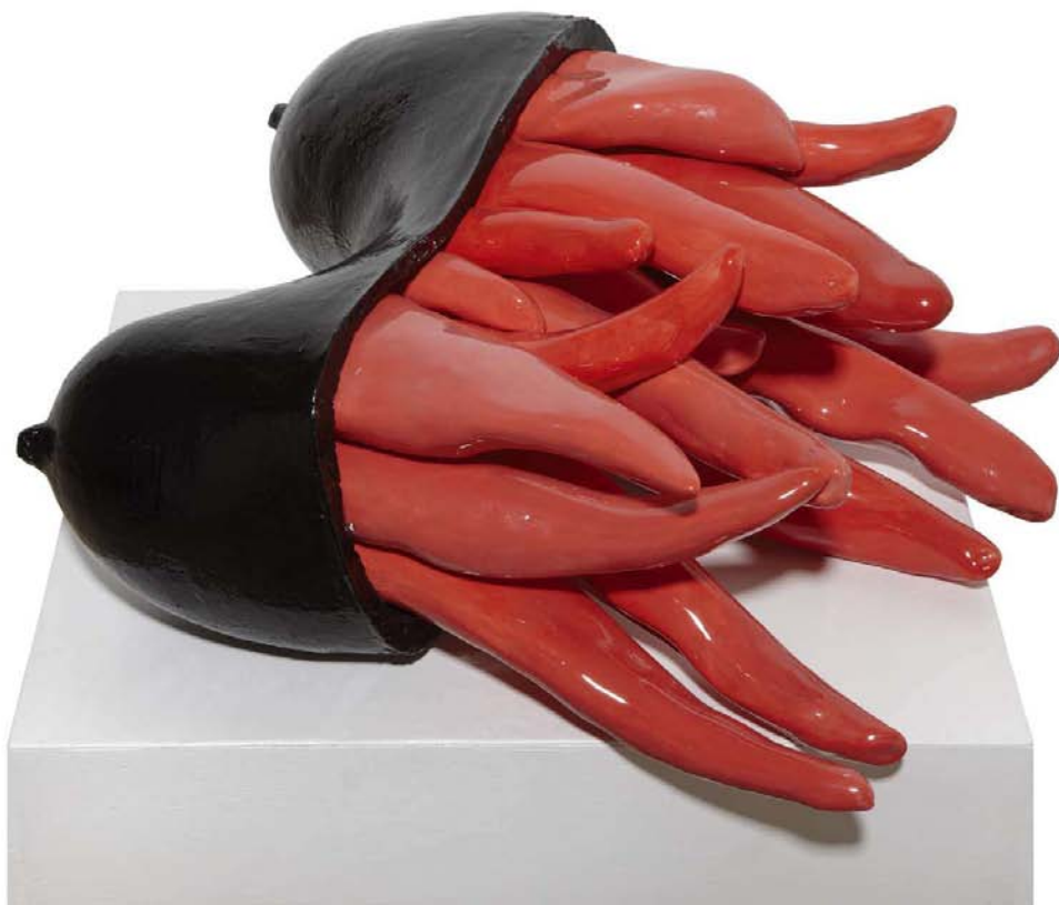
'tetas sanando'. Cerámica esmaltada. 18 x 36 x 47 cm.

harás una ofrenda, manará leche de tus pechos y sanarán con mirra tus heridas.