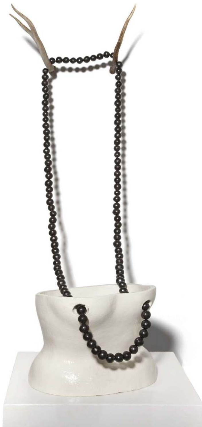
'Collar'. Cerámica esmaltada, barno negro de San Bartolo Coyotepec y cuemos. 110 x 40 x 52 cm.