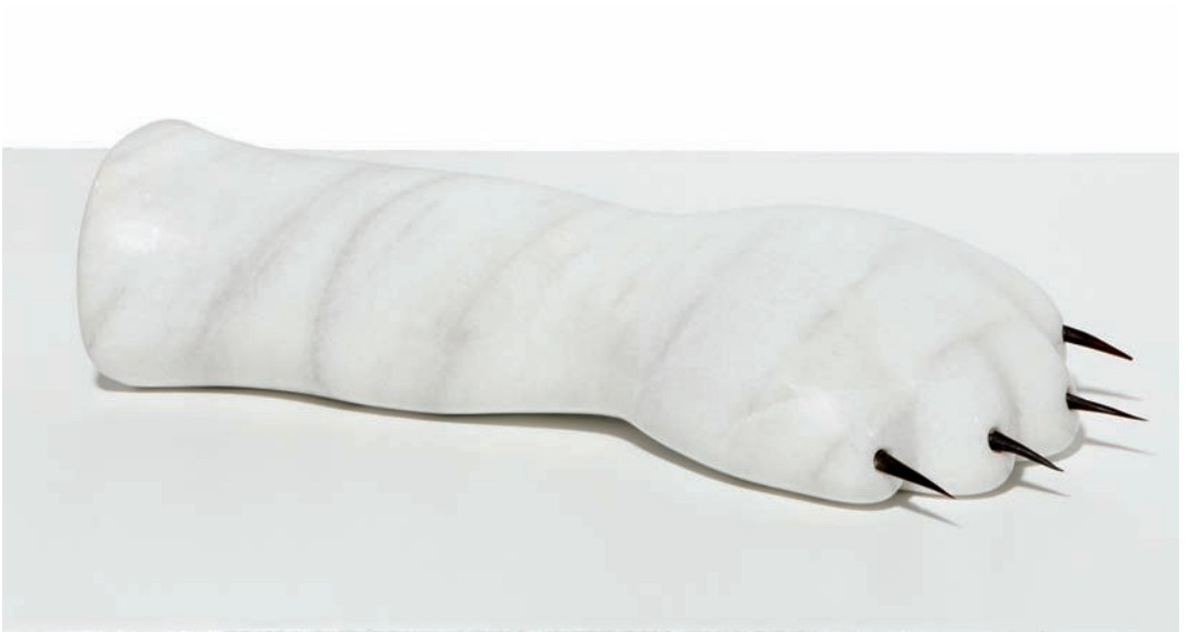
'El Aliento'. Marmol, 9 x 29 x 11 cm.