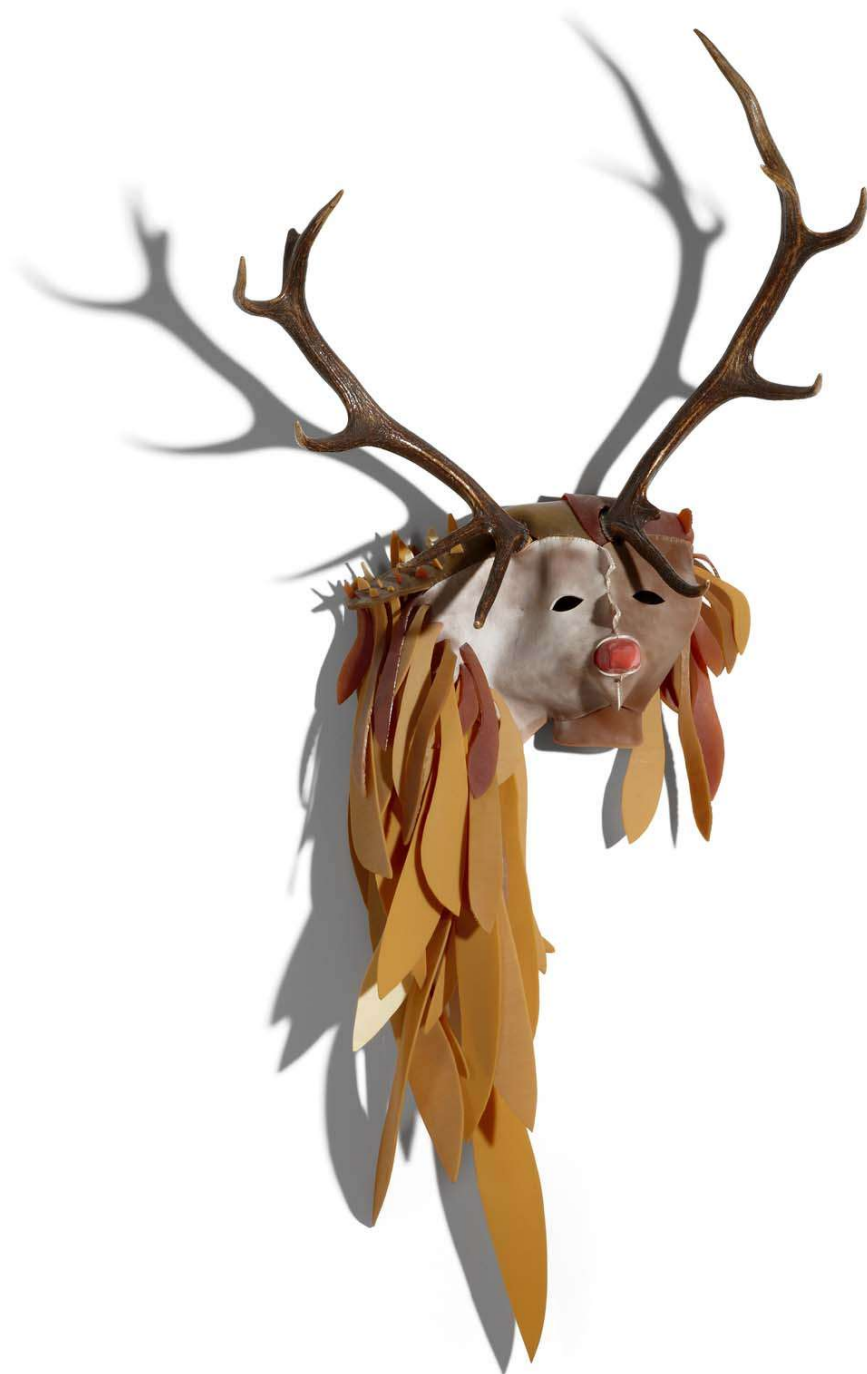
'Coyokahuqui decapitada fortalecida por su comamenta'. Goma, cerámica y cuernos. 160 x 42 x 68 cm.

te cortarás la cabeza y te crecerán cuernos.