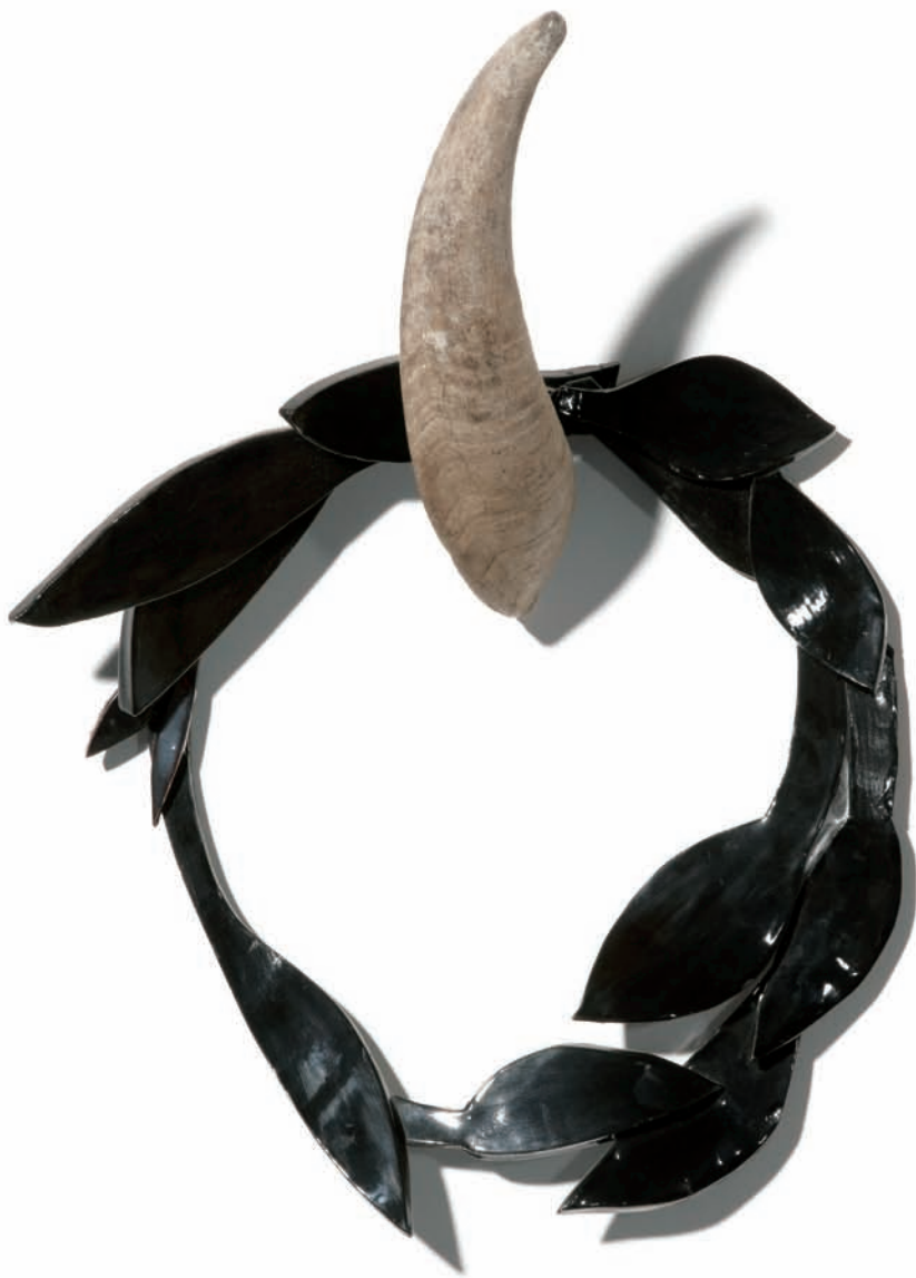
'Corona de Ceiba'. Cuerno y cerámica esmaltada, 35 x 25 x 5 cm.