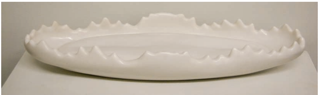
'La Tentación de su boca'. Marmol, 11 x 37 x 16 cm.