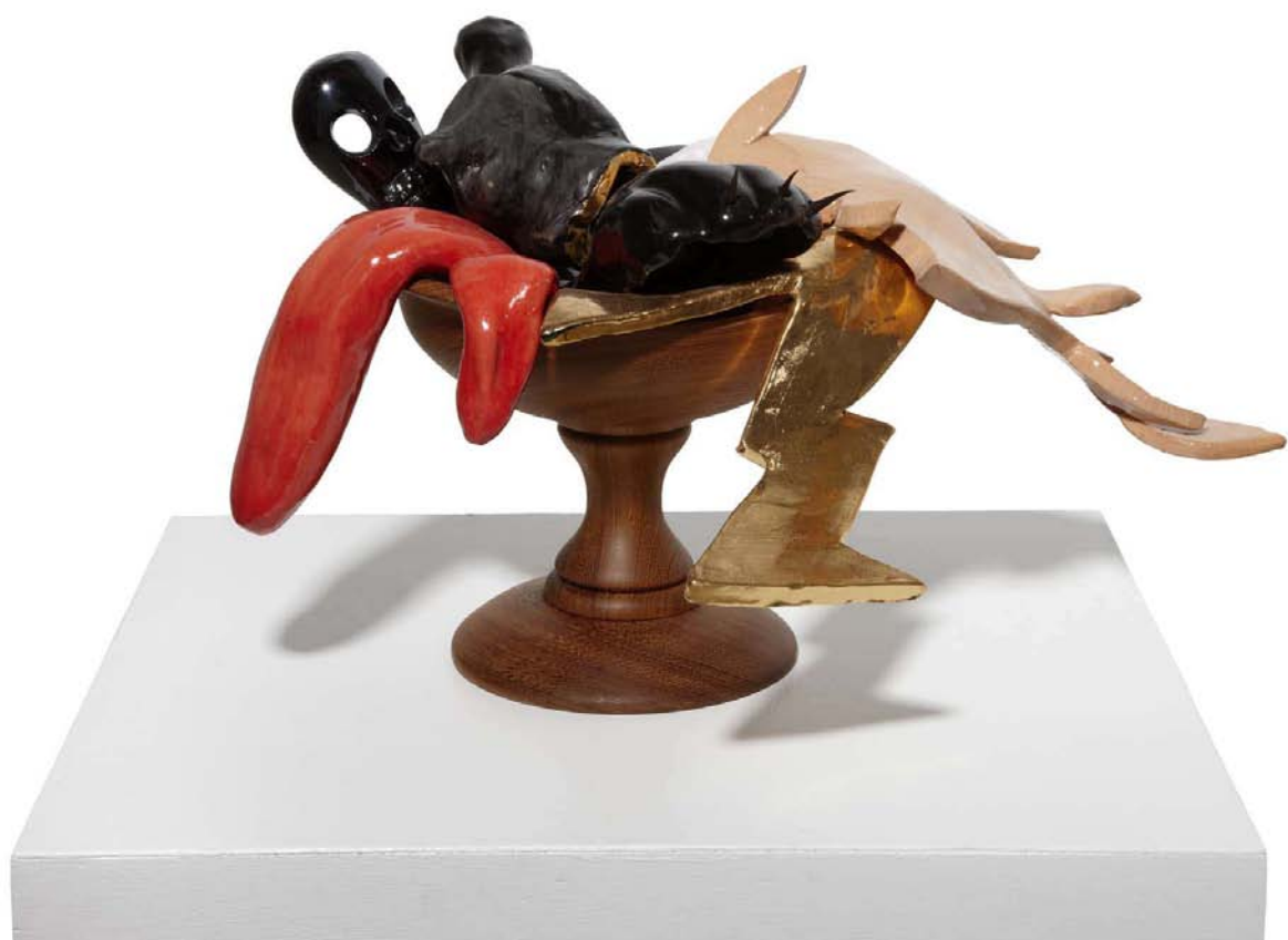
'Bodegón Las Fuerzas'. Cerámica esmalada, madera y espinas de agave. 32 x 37 x 29 cm.