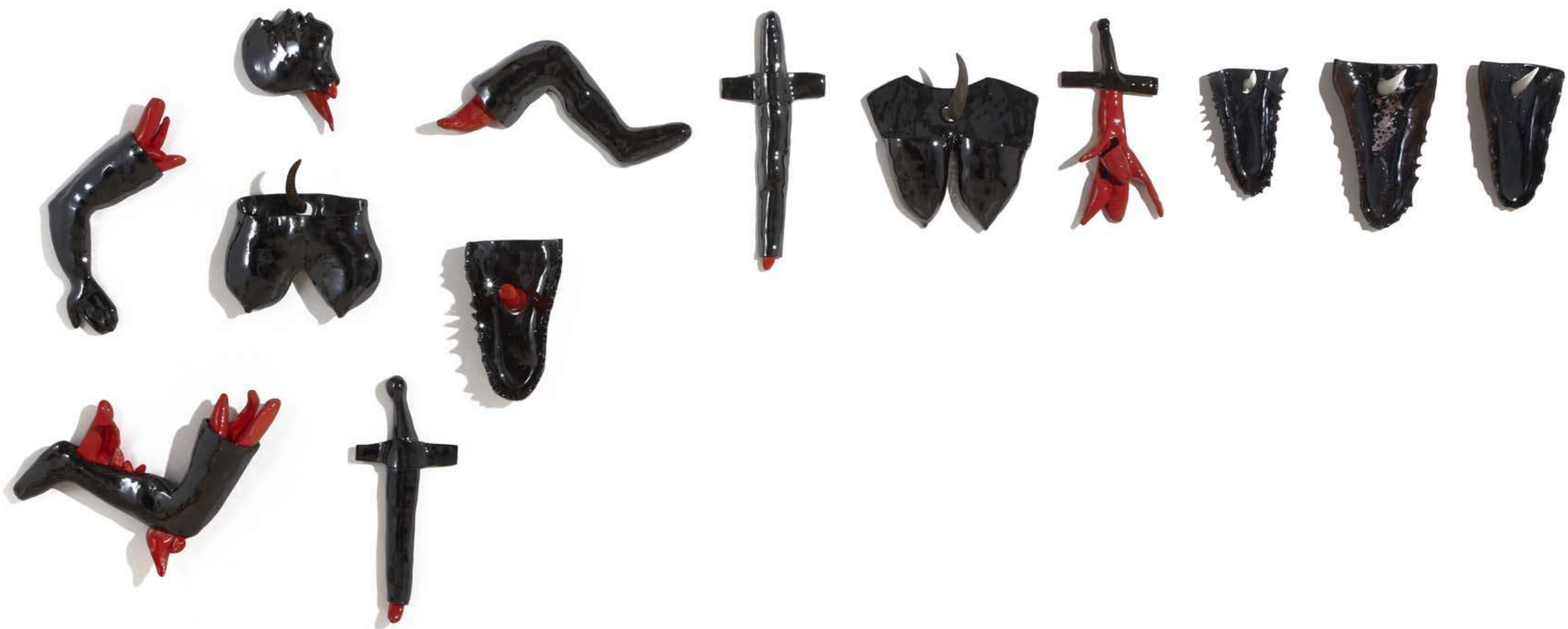
'Coyokahuqui desmembrada sanando sus heridas con mira'. Cerámica esmaltada, cuerno y mamol. 200 x 300 x 20 cm.(medidas variables)