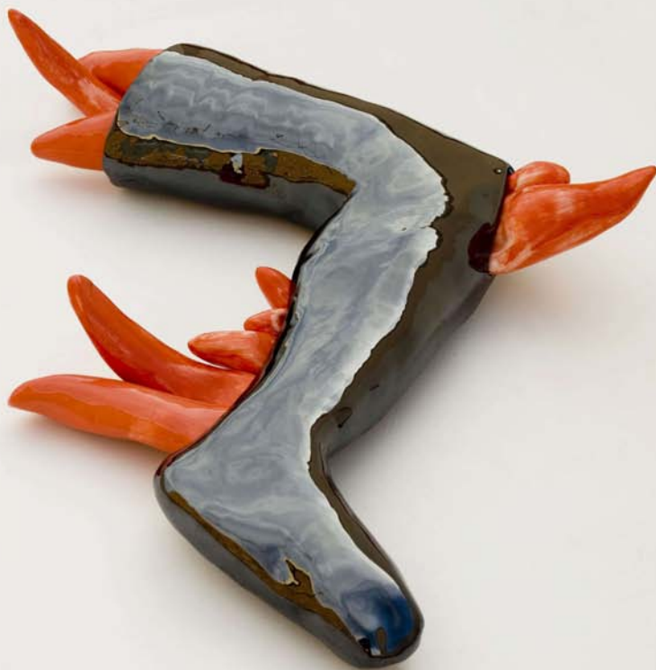
'Coyokahuqui desmembrada sanando sus heridas con mira; piema'. Cerámica esmaltada. 73 x 16 x 36 cm.