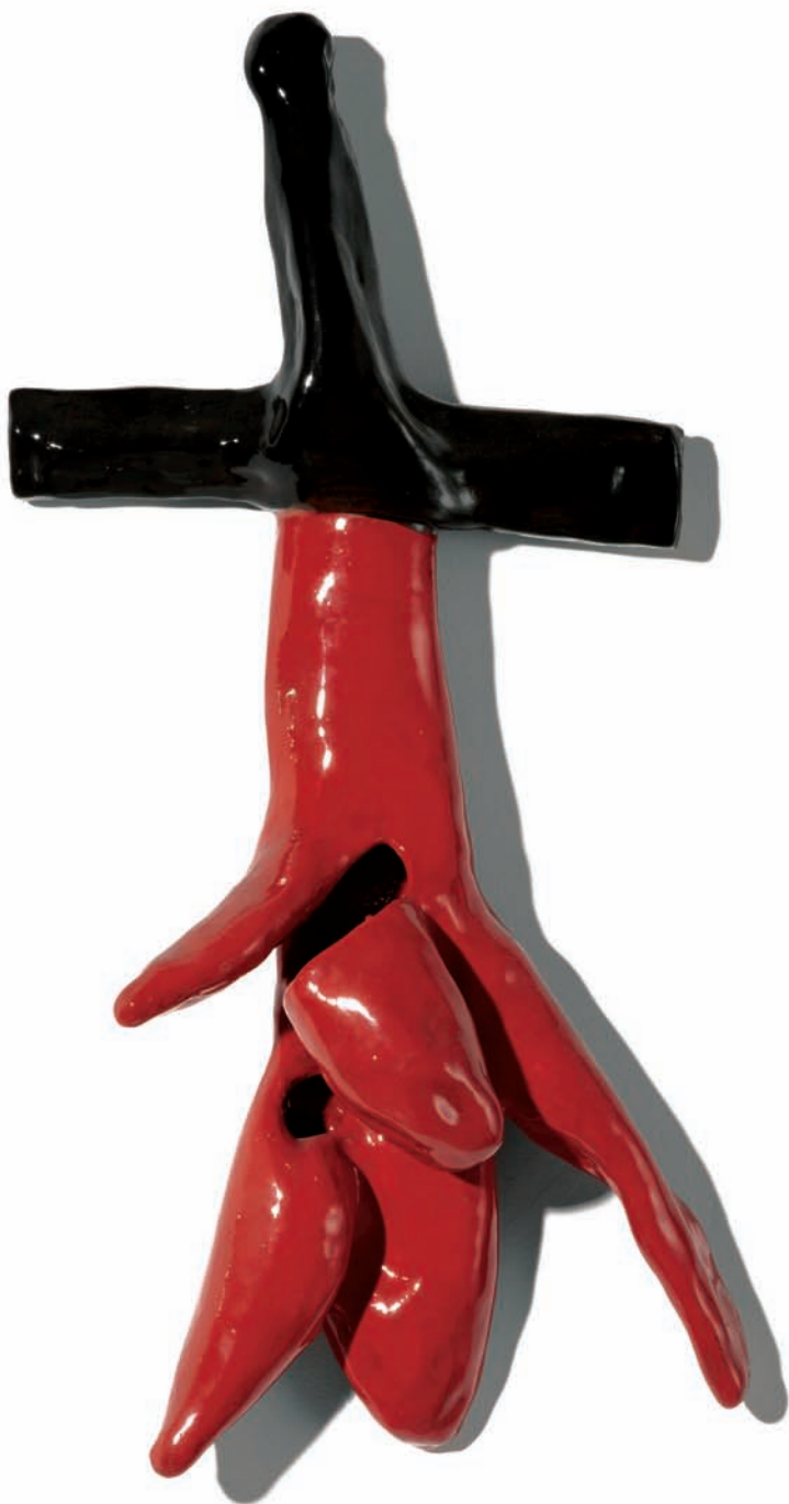
'Espada de mirra'. Cerámica esmaltada. 37 x 22 x 11 cm.