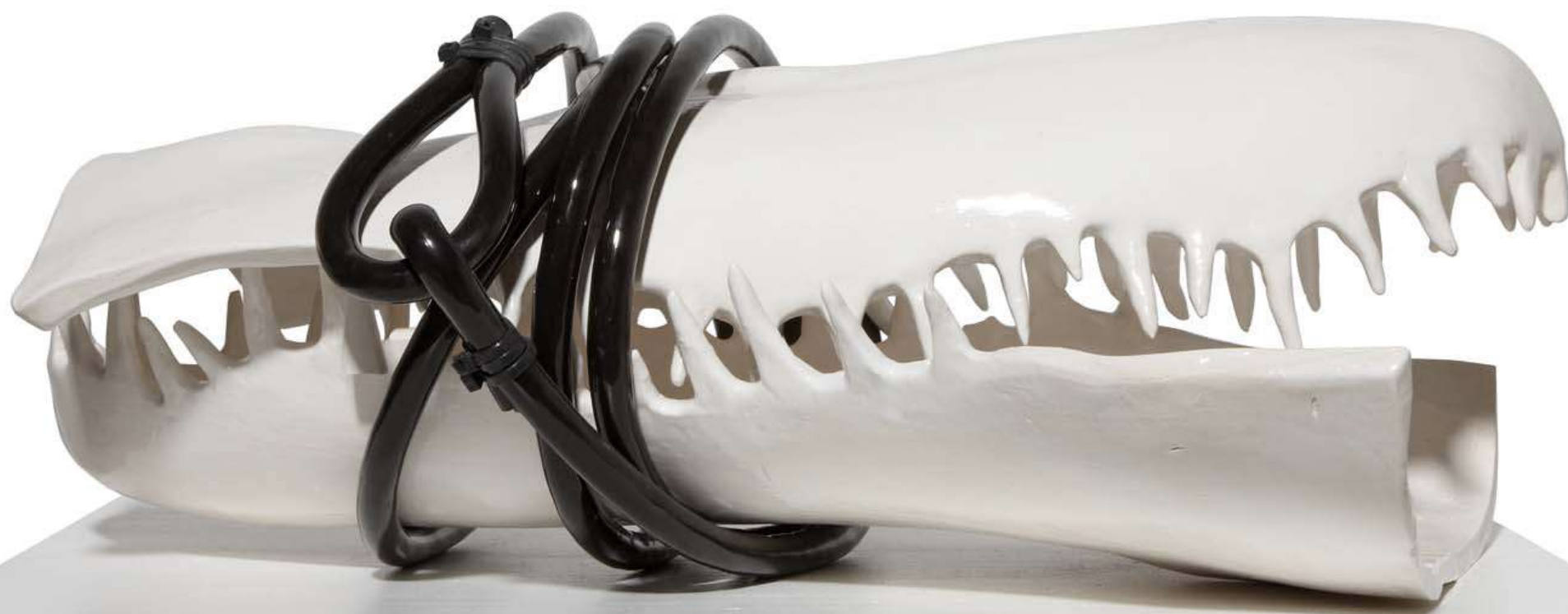
'La Tentación de su boca'. Cerámica esmaltada y cable, 19 x 38 x 25 cm.