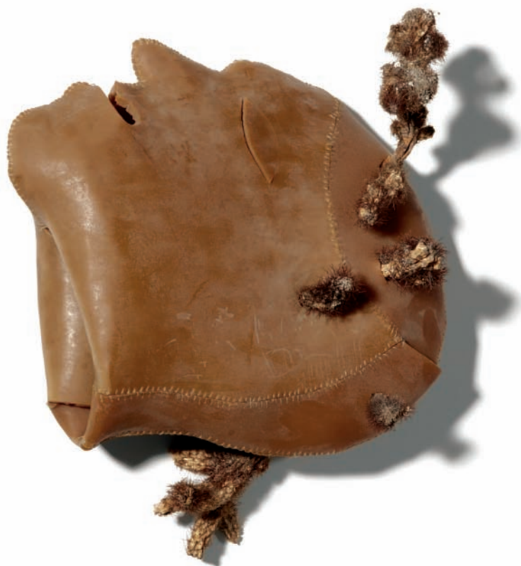
'Cabeza-Piel de Medusa'. Goma y cactus, 10 x 25 x 20 cm.