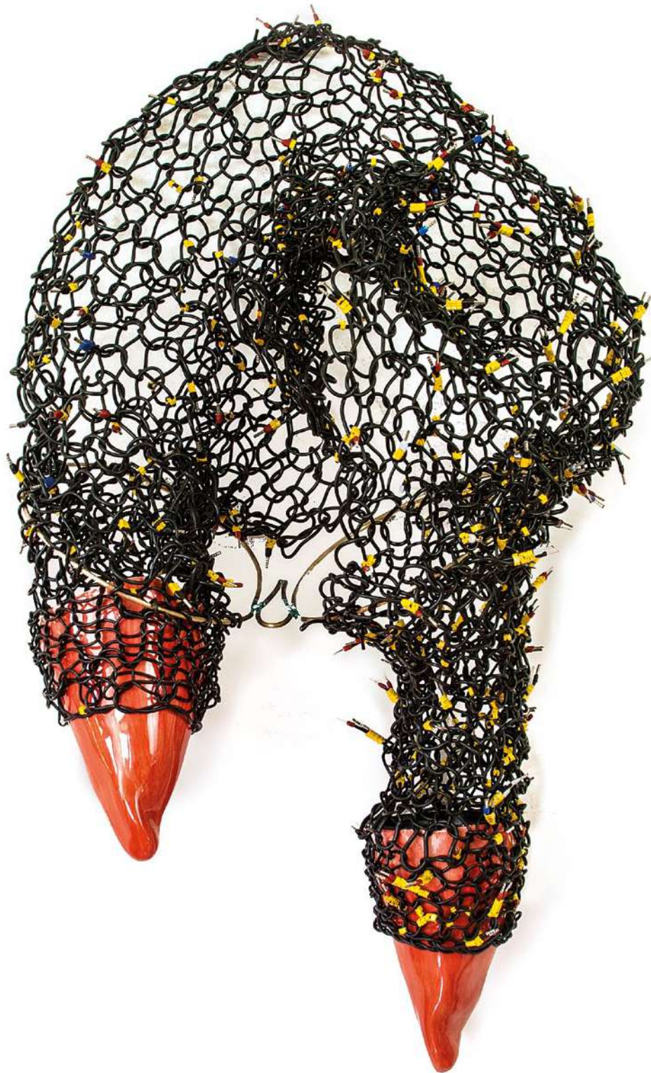
El mal en mí Cable tejido, cerámica esmaltada y latón 95x37x20 cm, 2018