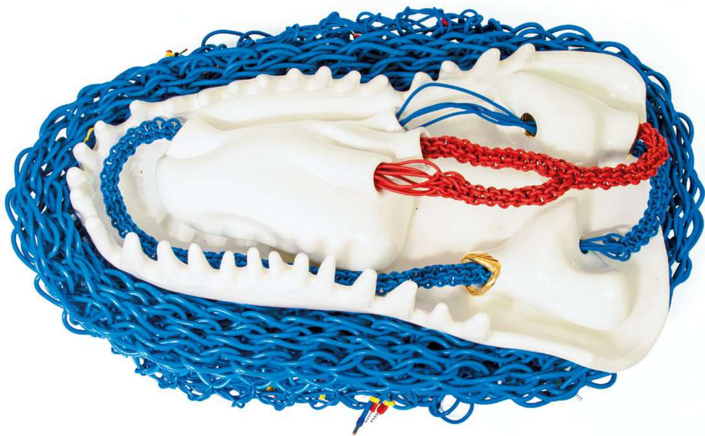
Impulsos y retornos Cable tejido y cerámica esmaltada 26x40x15 cm, 2018