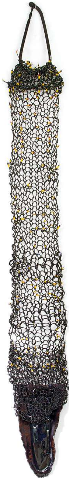
El mal en ti Cable tejido, cerámica esmaltada y piel 224x25x6 cm, 2018