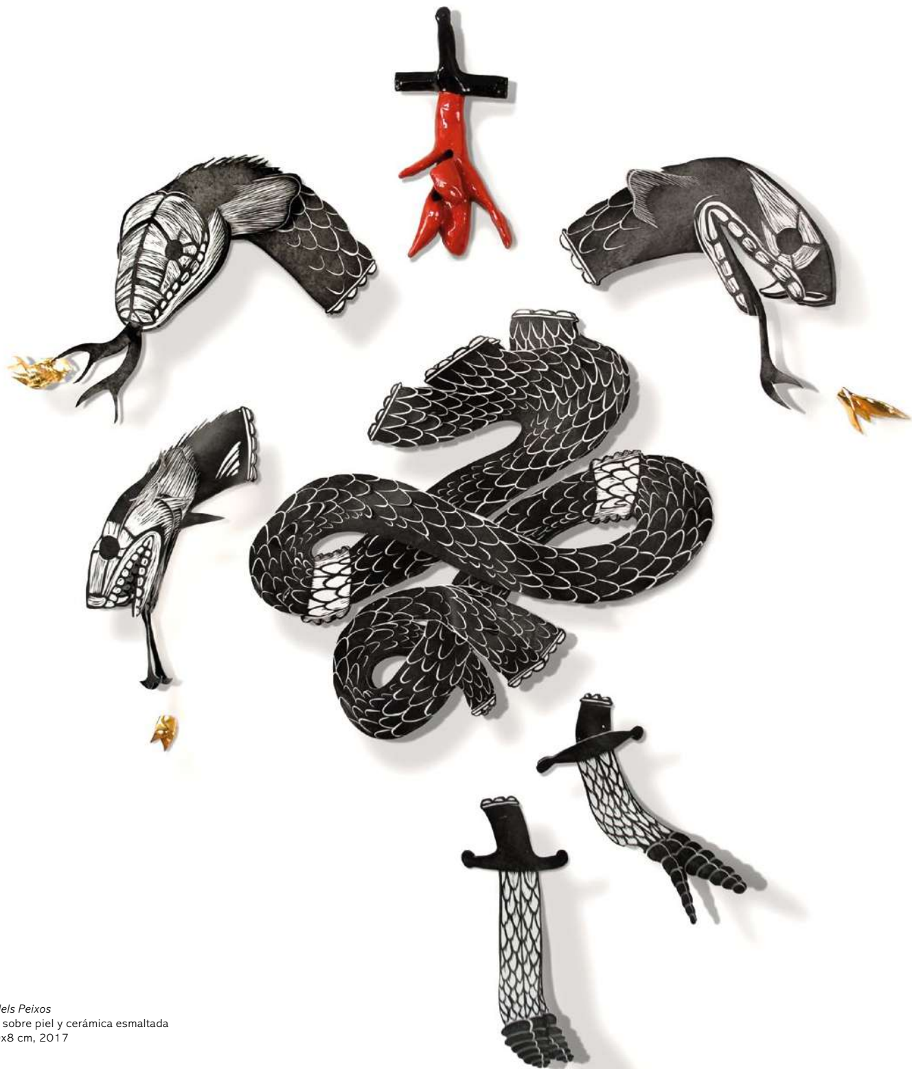
La Mare dels Peixos Xilografia sobre piel y cerámica esmaltada 200x180x8 cm, 2017