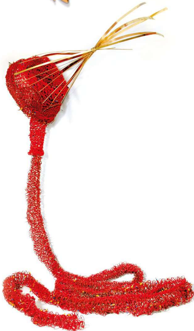
La Desollada Cable tejido, cerámica esmaltada en oro y latón 200x170x45 cm (medidas variables, intestino de 6 m), 2018