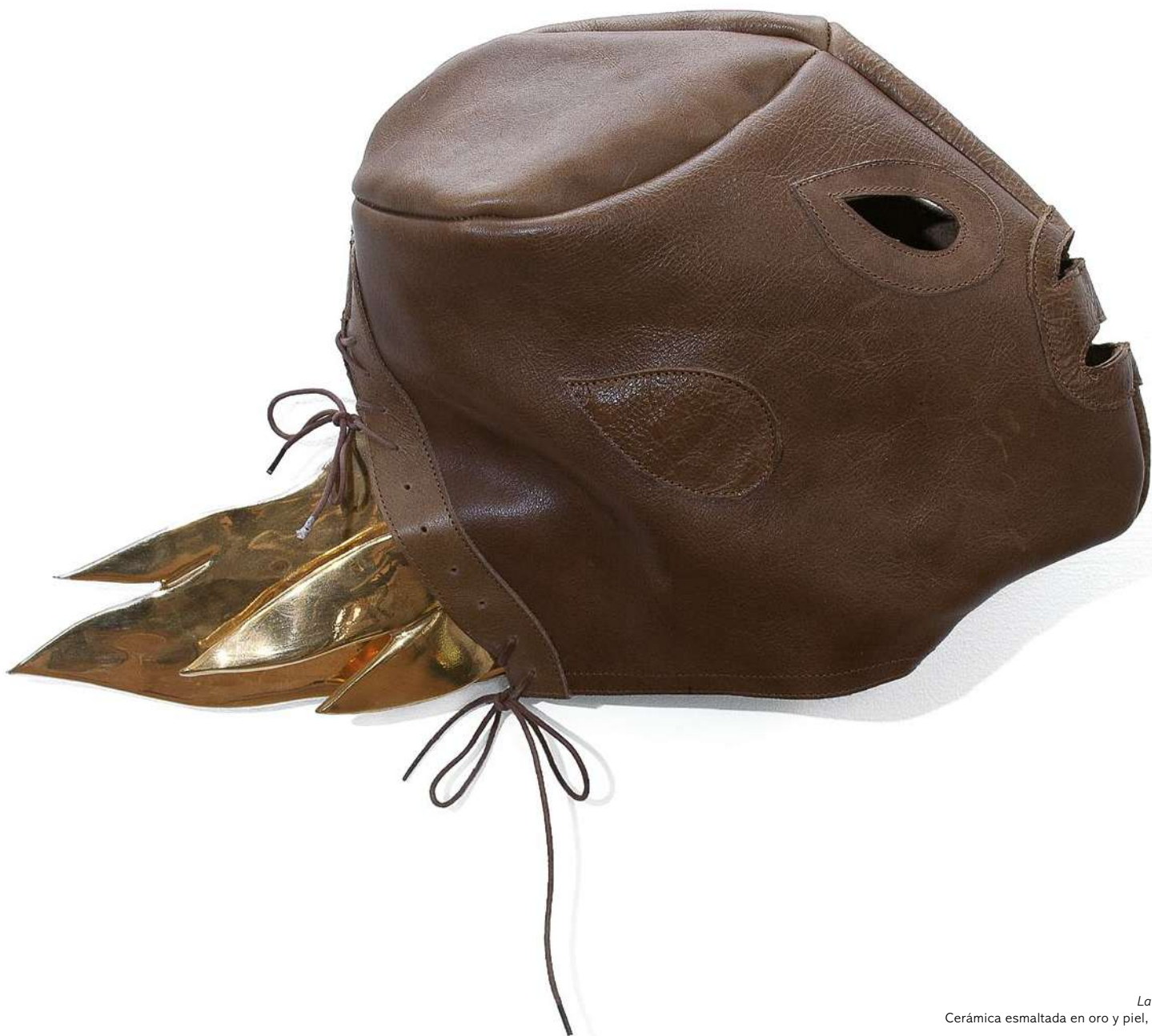
La lucha Cerámica esmaltada en oro y piel, 2016