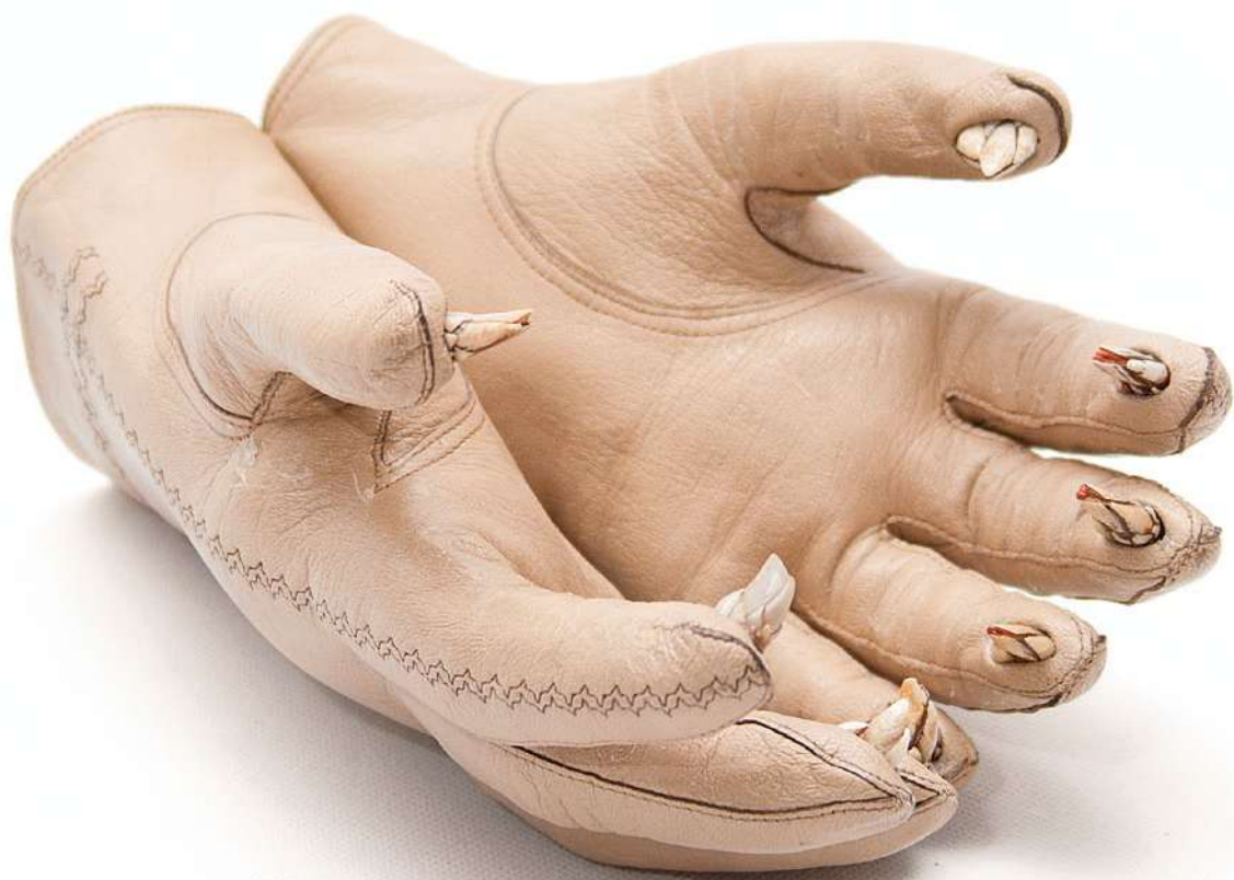
Guantes Piel y percebes 5x22x14 cm, 2017